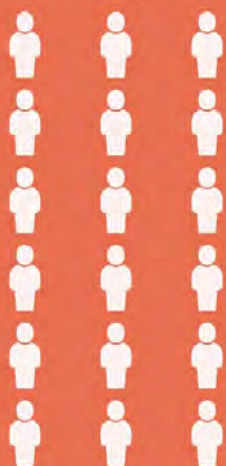
Erwartete Anzahl SportlerInnen