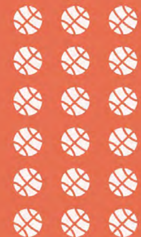
Erwartete Anzahl Mannschaften